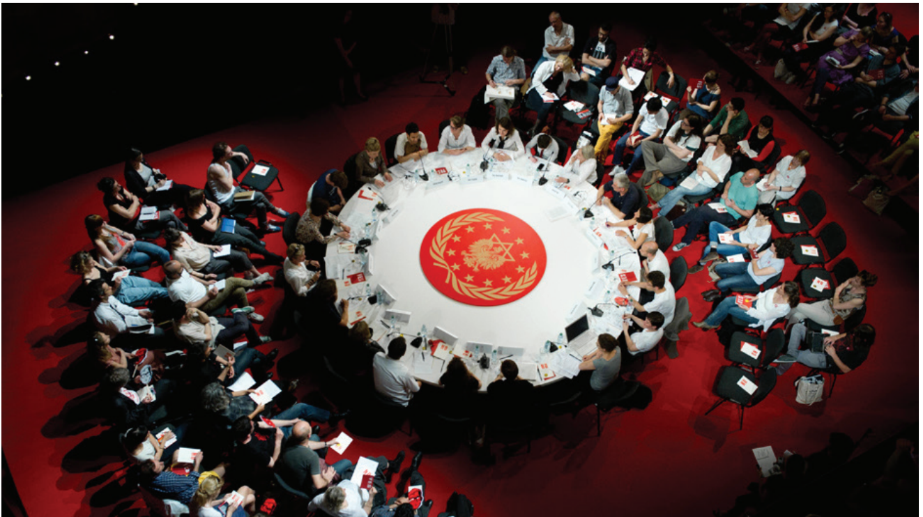
מתוך הקונגרס הבינלאומי הראשון של התנועה להתחדשות יהודית בפולין, 2012.