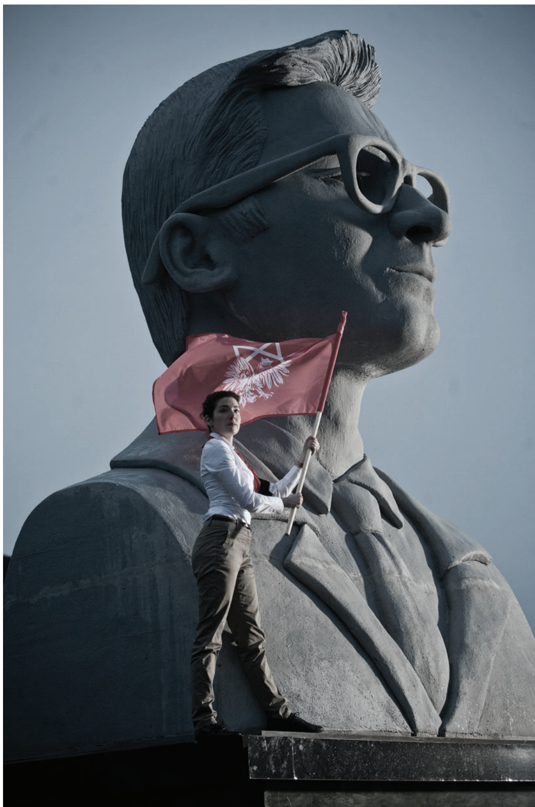
מתוך "התנקשות", כאן ובשלושת העמודים הבאים.