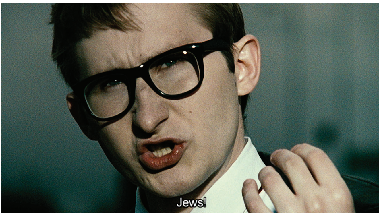
מתוך "מארי קושמרי", 2007.