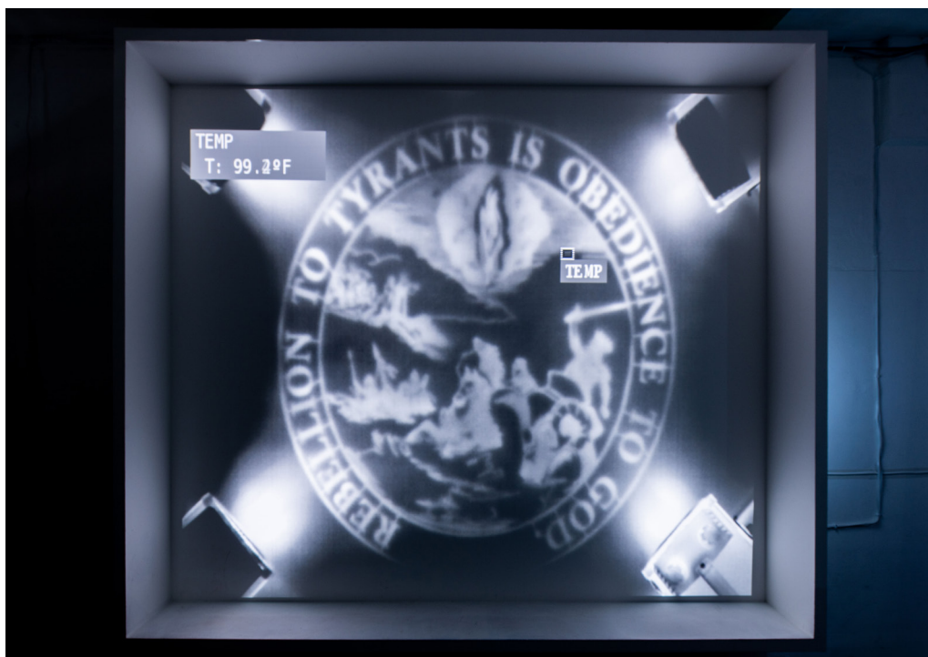
חותם מתוך התערוכה.

החותם הוא סמל הריבונות האמריקאית. בהצעתו המקורית של פרנקלין, שאומצה על ידי ג'פרסון ואדמס אך נדחתה על ידי הקונגרס, מובא סיפור יציאת מצרים וחציית ים סוף כאלגוריה פוליטית להקמת ארצות הברית. בהצעה שלהם, משה מביט יחד עם בני ישראל לעבר הארץ המובטחת בעוד פרעה וצבאו טובעים בים. המתישבים משולים לבני ישראל ופרעה משול למלך אנגליה. את החותם מקיפה הסיסמה "מרד בעריצים הוא ציות לאל". האמצעים הרטוריים של ההצעה הם חלק מהאתוס האמריקאי. הרעיון של מיעוט שסמכות אלוהית הקנתה לו את הזכות לשלוט באדמות אמריקה, המזוהה עם הפוריטנים, זכה לשם American Exceptionalism, ובמבט היסטורי הוא גם חלק בלתי נפרד מהנישול וההרג של האוכלוסייה הילידית. אפשר לראות ב"זכות" הזאת את המניע שהנחה במשך עשרות שנים את ההפצה של דמוקרטיה וכלכלה נאו-ליברלית במדינות החוץ האמריקאית, ואת הפעלתם של כוחות צבא מעבר לים.